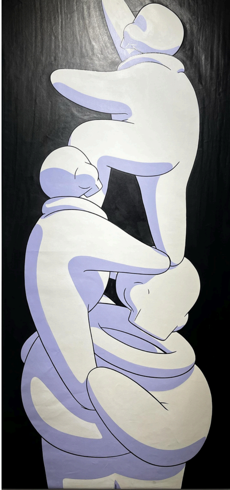
Generations Acrylique on 100% linen canvas, format 94 x 217 cm.