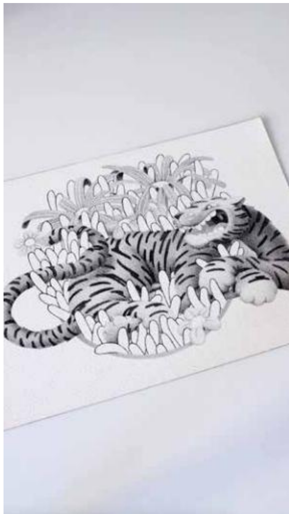
Tiger among lowers

created on a 300 gsm Arches paper Pointillisme with Rotring Isograph 0.1 format 26 x 18 cm.