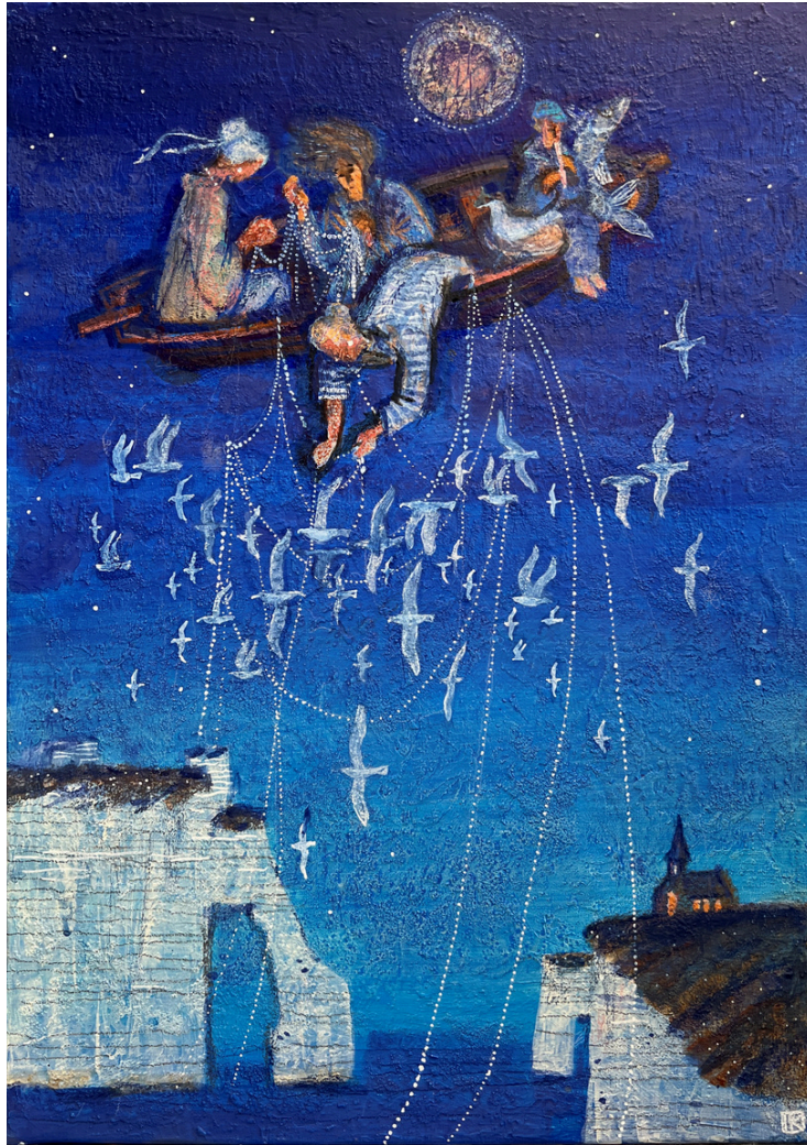
Barque céleste Tempera, crayon sur toile 50 x 35 cm, 2026