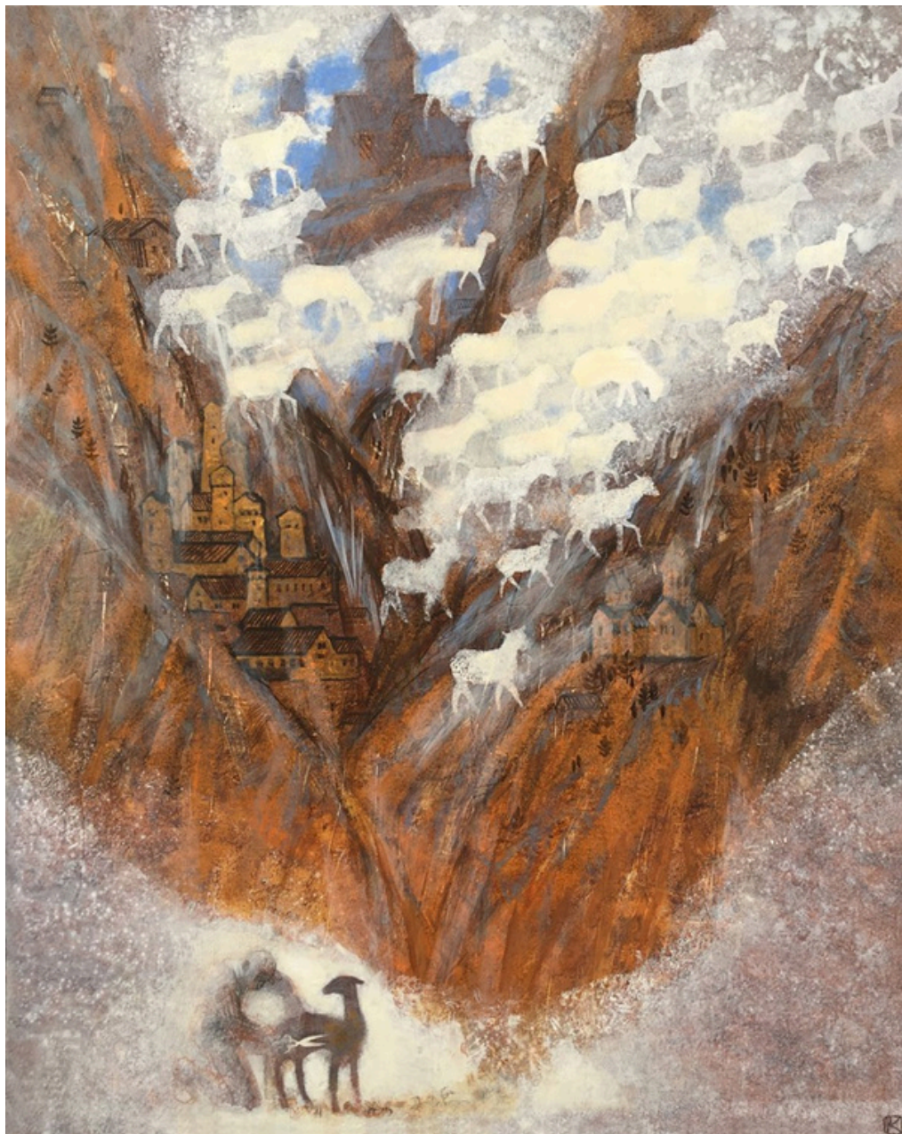
Cisaillement de Bélier Tempera, acrylique sur toile 92 × 73 cm, 2022