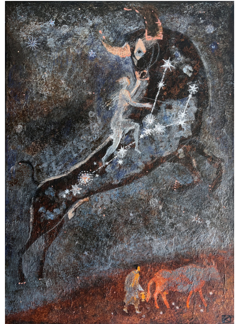
Constellation de taureau Tempera sur toile 50 x 35 cm, 2026