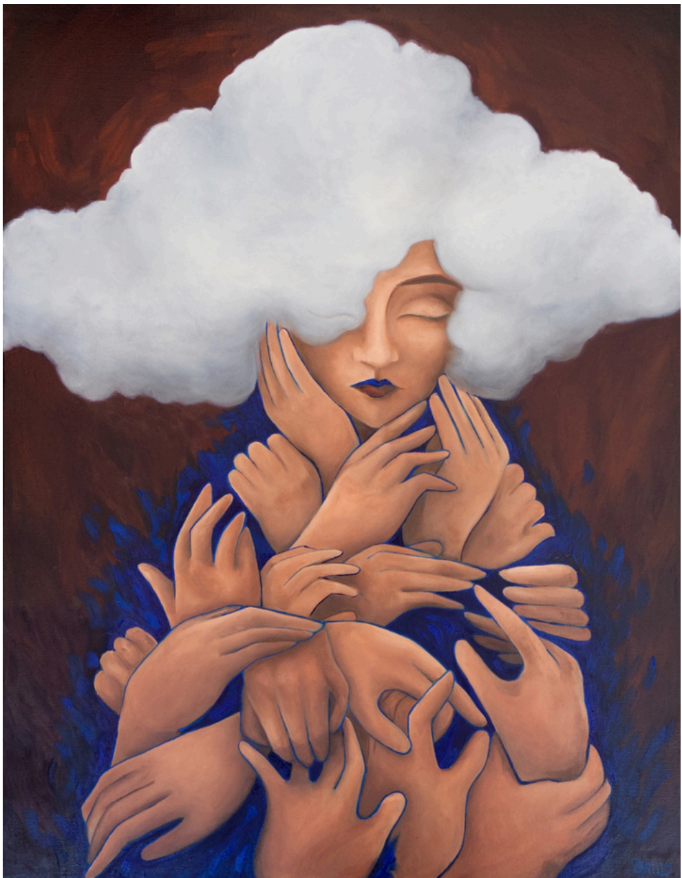
L'Âtre Huile sur toile 65x50 cm