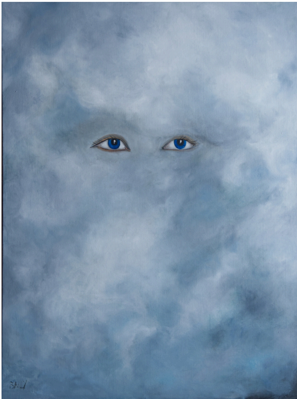
Embrumée Huile sur toile 60x81 cm