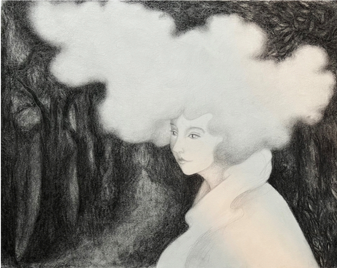
● L'errance Crayon et fusain 32x40 cm 250 € 300 € avec cadre