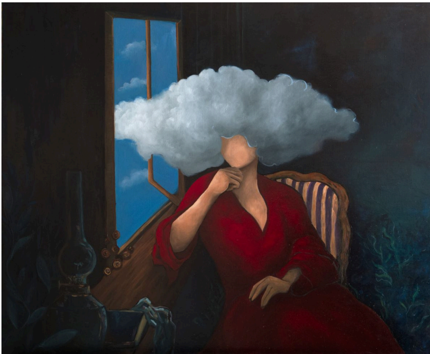
Le départ Huile sur toile 73x60 cm