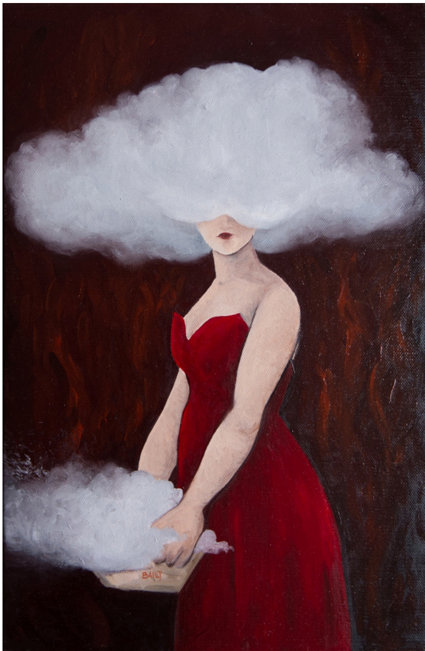
● Salomé dans la brume Huile sur toile 41x27 cm