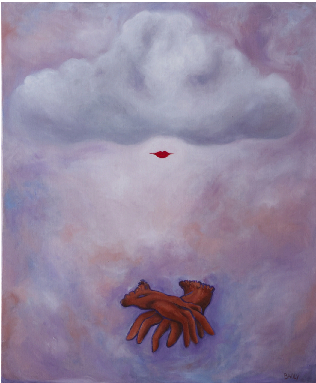
Gants de soi Huile sur toile 54x65 cm